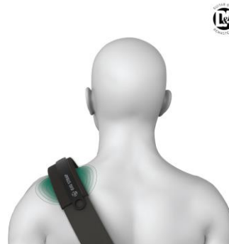
肩の快適な場所に固定