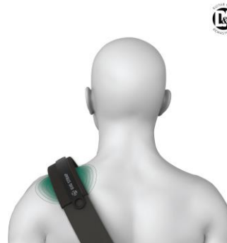
肩の快適な場所に固定