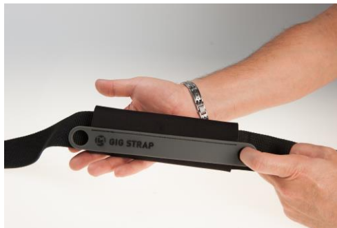
両サイドにスライドさせて位置を調節