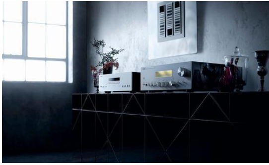
プリメインアンプ「A-S2100」 CD プレーヤー「CD-S2100」