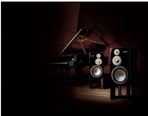
ヤマハ HiFi スピーカーのフラッグシップモデル 「NS-5000」