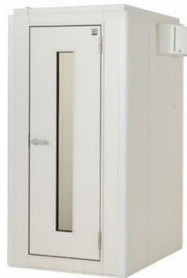
ヤマハ防音室 アビテックス「セフィーネ NS」