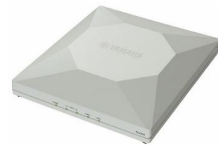
ヤマハ無線 LAN アクセスポイント「WLX402」