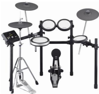
ヤマハ電子ドラム「DTX562KFS」