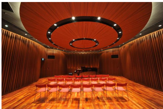
ヤマハ銀座ビル 6Fコンサートサロン