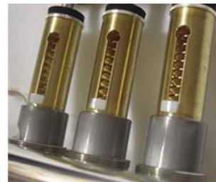
樹脂製バルブガイド