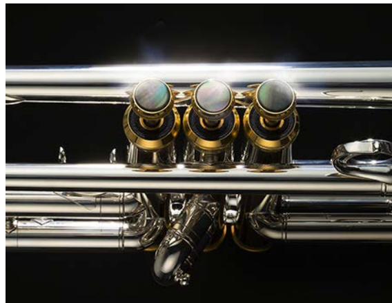
黒蝶貝をあしらったピストンボタン