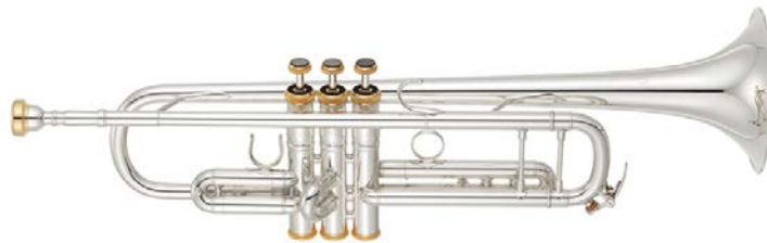
ヤマハ トランペット「YTR-9335VS」

株式会社ヤマハミュージックジャパン（本社：東京都港区、代表取締役社長：小林和徳）は、ヤマハ トランペットの新製品「YTR-9335VS」「YTR-9335VGP」を12月15日（金）に発売します。