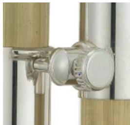
第3抜差管ストッパーネジ