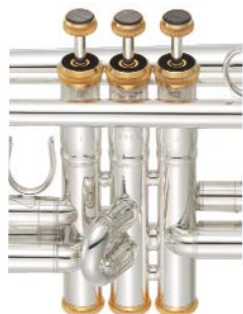
ピストンボタンとトップキャップ および、ボトムキャップ

ピストンボタンとトップキャップおよび、ボトムキャップに金メッキ仕上げのパーツを採用するほか、ピストンボタンの上部に黒蝶貝をあしらうなど上質な素材を用い、外観における存在感も追求しています。