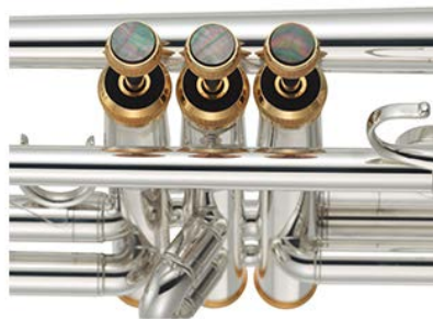
ピストンボタンの黒蝶貝