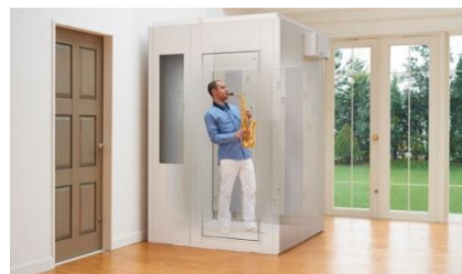
防音室「セフィーネ NS」