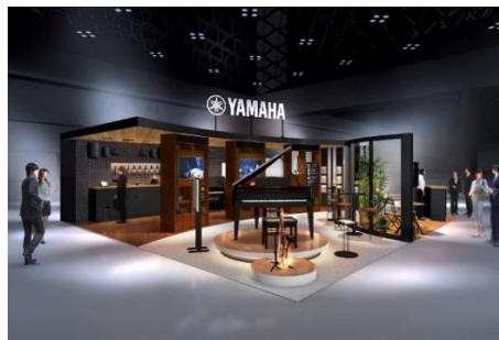
「JAPAN SHOP 2018」ヤマハブース

「JAPAN SHOP 2018」は、「日経メッセ 街づくり・店づくり総合展」（主催：日本経済新聞社）として開催される展示会のうちのひとつで、商空間のデザイン・ディスプレイをはじめ、魅力的な店づくりのための最新情報を発信する日本最大級の店舗総合見本市です。