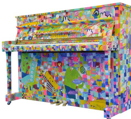
LovePiano をテーマに塗装を施した「ペイントピアノ」

「LovePiano」は2017年秋、ヤマハピアノのプロモーションの一環として当社が立ち上げたプロジェクトです。活動を通し、より多くの方にピアノを身近に感じていただくとともに、ピアノの魅力や演奏の楽しさをお伝えしています。「LovePiano」をテーマにヤマハのアップライトピアノに塗装を施した「ペイントピアノ」を、JR新宿駅新南改札外「Suicaのペンギン広場」や、東京湾アクアライン・海ほたるパーキングエリアなどのオープンスペースに設置するほか、「ペイントピアノ」の写真や動画を募集するキャンペーンを展開するなど、多くの方に気軽にピアノに触れていただくためのさまざまな活動に取り組んでいます。