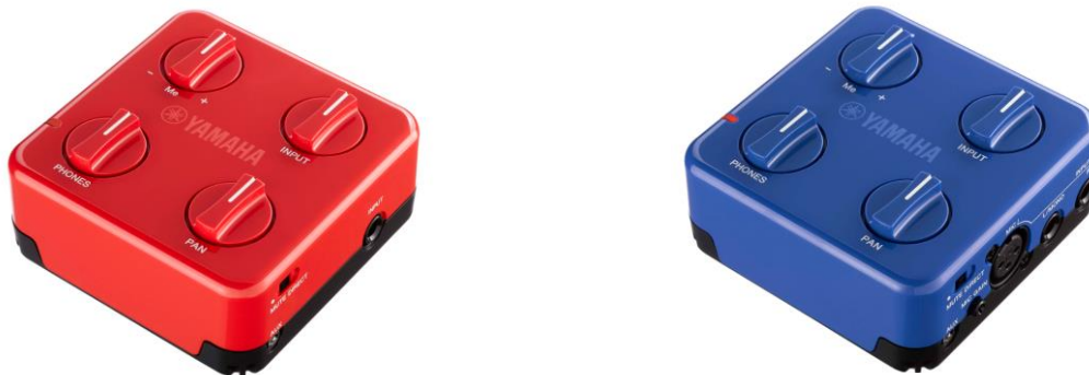
ヤマハ ミキシングヘッドホンアンプ「SessionCake（SC-01/SC-02）」

このたびの「SessionCake」の優待販売は、新生活をスタートした学生や音楽教室で学ぶ方々を対象にした、楽器練習を快適にし、楽器演奏の楽しみ方をさらに広げていただくためのご提案です。