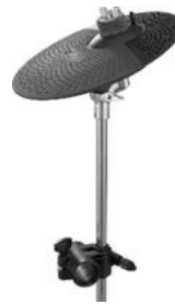
ヤマハ電子ドラム用シンバルパッド「PCY95AT」