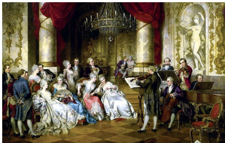
圖為奧地利畫家 Carl Schweninger 於 19 世紀末的作品，描述一室內樂團為私人場合演奏。

歷史文獻中，最早出現這種形式且在小空間演奏的記錄，可追溯至 16 世紀初、文藝復興後期。在當時，音樂被認為是重要的社交工具；男人們認真的投入音樂學習、在團體裡演唱，女人們也（不對外的）參與室內樂演奏。宮廷之外，音樂也逐漸在中產階級、人民的家中興盛起來。