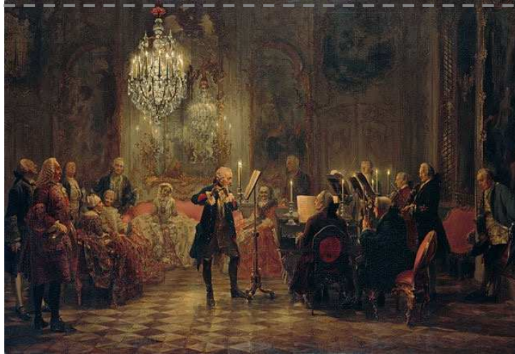
圖為德國油畫家 Adolph Menzel 所畫的 18 世紀宮廷 內流行的室內樂形式。腓德烈大帝吹奏長笛、波西米 亞作曲家 Franz Benda 演奏小提琴、C. P. E. Bach 擔任鍵盤，以及其他未具名的小提琴演奏者。

十九世紀起，因為社會型態的改變，「室內樂」一詞一般指的是寫給小編制樂團的音樂，且每位演奏者各自負責一個聲部，此點與交響樂團多人負責同一聲部的做法非常不同；小編制的樂曲型態使得聲響效果更為純淨，樂團裡使用的每樣樂器也能在樂曲中展現的透亮清晰。室內樂的作品可能是為私人，或為公眾寫的曲子；為公開場合，或為小型音樂廳所寫。