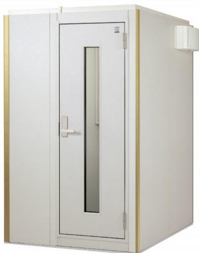
ヤマハ防音室「セフィーネⅡボックス R/E1」1.5 畳