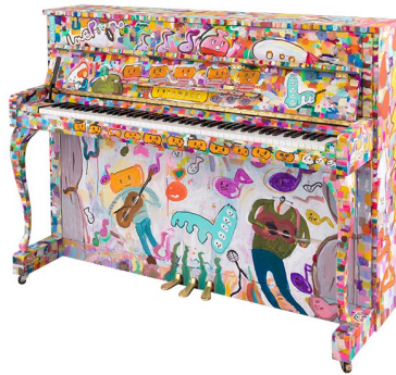
ヤマハのアップライトピアノ 愛称“LovePiano”

株式会社ヤマハミュージックジャパンは、外装にデザインを施したヤマハのアップライトピアノ（愛称“LovePiano”）を2021年3月22日（月）～31日（水）に、神奈川県・小田原駅東口2階東西自由連絡通路 アークロード（二宮金次郎銅像横）に設置します。期間中は、どなたでも自由に弾くことができます。