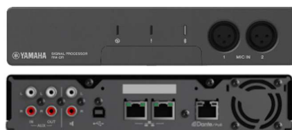
遠隔会議用プロセッサ RM-CR (上:表、下:裏)