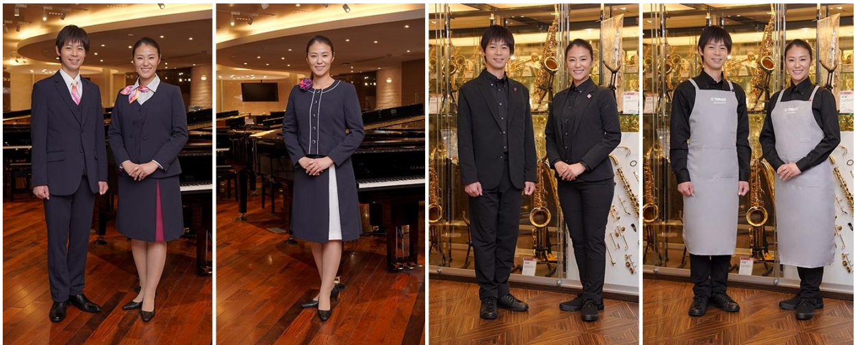
担当別のユニフォーム：左から、鍵盤・管弦打楽器・楽譜の売場・教室、インフォメーション（銀座店）、デジタル楽器の売場、管弦楽器リペア

ヤマハの楽器店、教室のスタッフは、“Make Waves”を基に新たなユニフォームで多くのお客さまをお迎えし、自らの仕事に誇りを持ち、よりよい商品・サービスを提供し、愛されるブランドを目指してまいります。