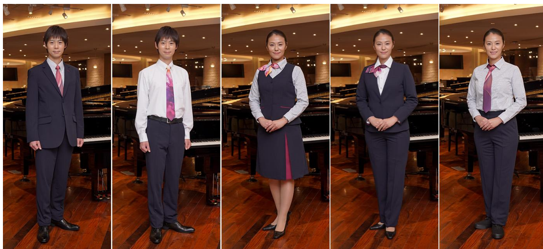
バリエーション豊かなクラシックスタイル

株式会社サーヴォ（東京都中央区日本橋） https://www.servo-uni.com/