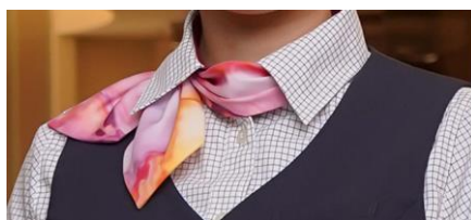
“Wave”をあしらったリボン