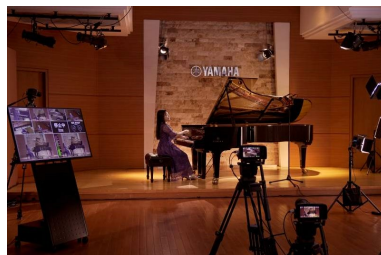
5台のカメラを使用し、 マルチアングルで撮影