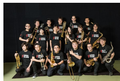
Z EXPRESS BIG BAND

https://member.jp.yamaha.com/topics/z_express_big_band