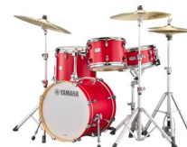
ヤマハ アコースティックドラム 「Tour Custom」