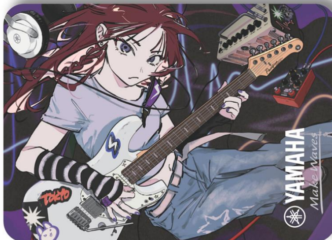
配布されるオリジナルステッカー（イメージ）

※国内の楽器店、ECサイト（一部を除く）での配布です。また、景品が無くなり次第終了します。